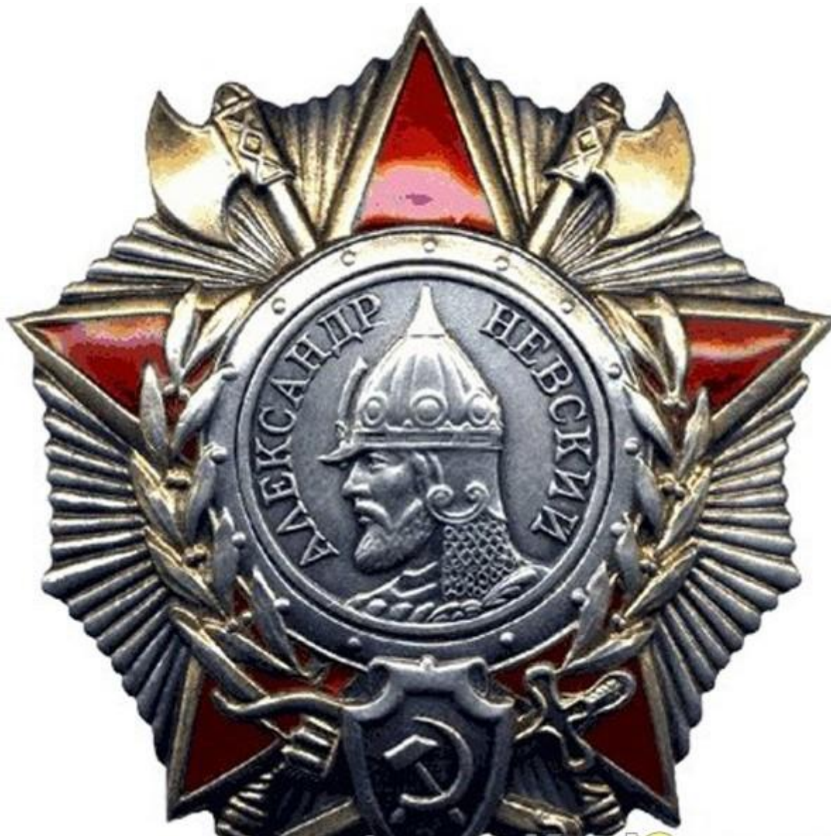
Орден Александра Невского

Награды героя: Награжден орденом Отечественной войны второй степени, орденом Богдана Хмельницкого и двумя орденами Александра Невского, орденом Ленина, Звездой Героя Советского Союза.