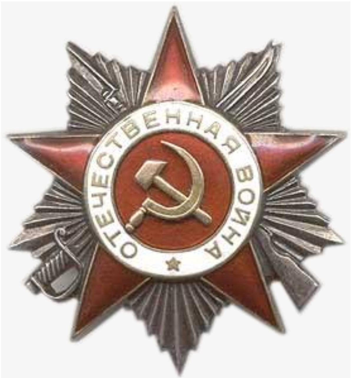
Орден Отечественной войны II степени